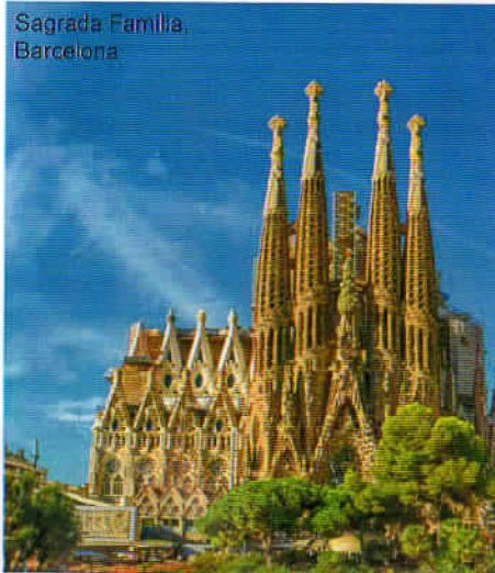
Sagrada Família, Barcelona

Nach der Feier einer heiligen Messe erwartet uns eine Panoramastadtrundfahrt, wobei wir die wichtigsten Sehenswürdigkeiten kennenlernen: Placa de Catalunya - einer der größten und